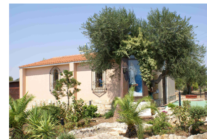
Garten „Himmelsgrün“ (Erscheinungsort der Muttergottes)