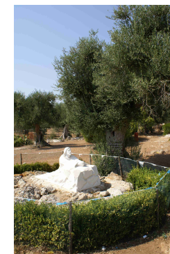
Jesus im Garten