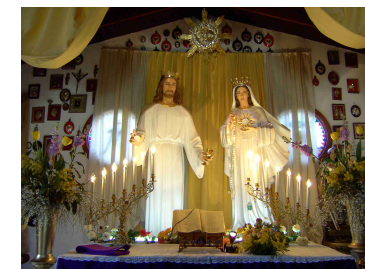
Statue „König der Offenbarung“ & „Jungfrau der Hl. Eucharistie“