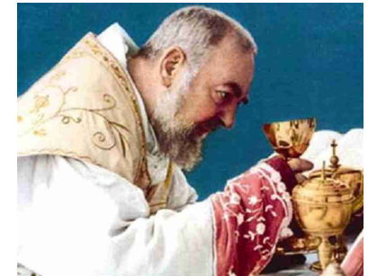
Hl. Pater Pio