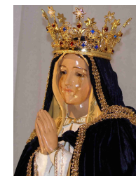
Fatimastatue weint blutige, ölige Tränen